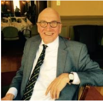
Bijdrage: Cees Postema