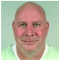
Bijdrage: Leo de Bruin